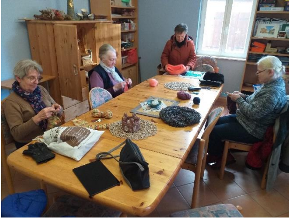
Handarbeitskreis Werben