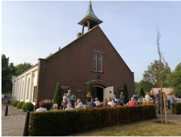
Gemeinsamer Barbecue-Abend an der Kirche Klaarenbeek, Juni 2023

Man besucht sich, telefoniert oder schreibt über WhatsApp, auch außerhalb der offiziellen Gemeindefahrten. Diese gibt es nur einmal im Jahr. Nachdem eine Seehäuser Gruppe im Juni 2023 dort zu Gast war, erwarten wir im Mai eine Gruppe aus den Niederlanden. So hat man an diesem Wochen-