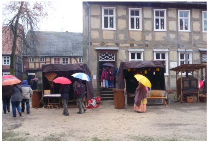
Das Rusterhaus während des letzten Biedermeier-Christmarktes

Dieses Schulhaus hat dann über 100 Jahre seine Aufgabe erfüllt, bis es um 1930 durch die heutige Schule vor dem Seehäuser Tor ersetzt wurde. Danach diente es der Kirchengemeinde als Wohnung für den Küster, der Gemeindegemeinschaft sowie dem Religions- und Konfirmandenunterricht. Nach der Wende verfiel es mehr und mehr zu einem Schandfleck für die ganze Stadt. Anfang des Jahres 2009 zeigte es sich mit zerschlagenen Fenstern und Türen sowie großen Löchern im Dach. Die Kirchengemeinde sah sich aber nicht mehr in der Lage das Geld für die notwendigen Reparaturen aufzubringen (wie