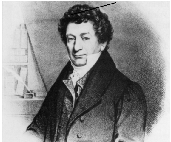
F. W. Sertürner (1783-1841)

Friedrich Wilhelm Sertürner wurde 1783 in Neuhaus bei Paderborn geboren. 1799-1803 absolvierte er eine Apothekerlehre. 1804 isolierte er das Morphium, den Hauptwirkstoff des Opiums. Allerdings wurde die Bedeutung seines Fundes erst 1817 anerkannt. Im diesem Jahr erhielt er die Ehrendoktorwürde der Universität in Jena. 1833 vermutete er, dass der Erreger der Cholera ein "giftiges, belebtes, also sich selbst fortpflanzendes Wesen" sei = ein halbes Jahrhundert bevor Robert Koch das Choleraerkeim entdeckte. Zum damaligen Zeitpunkt fand Sertürner mit seiner Annahme kein Gehör und er reagierte verbittert. Er veröffentlichte seine Arbeiten nur noch in einer eigenen Zeitschrift, den "Annalen für die Universalsysteme der Elemente" und als gesonderte Flugblätter. 1844, drei Jahre nach Sertürners Tod in Hameln, wurde Morphium erstmals als Schmerzmittel angewendet.