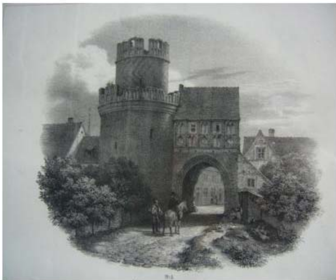
Das Werbener Elbtor, ein spätgotischer Backsteinbau wurde 1460 bis 1470 von Stephan Buxtehude erbaut. Auf dieser aus dem Jahre 1844 stammenden Darstellung erkennt man, daß sich auf dem Torbogen eine Art Torwächterhaus befand.