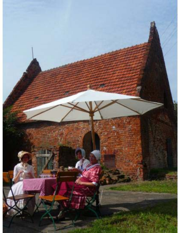
Bei sonnigem Wetter ließ es sich schön vor der Lambertikapelle sitzen

Ein Besonderheit war die Präsentation der Lambertikapelle durch die Familie Gellerich. Am Stand der AWA war neben Kaffee und Kuchen auch ein Faltblatt zur Geschichte und kulturhistorischen Bedeutung des Bauwerks erhältlich. Immerhin handelt es sich um das älteste Gebäude der Stadt Werben. Die Kapelle war vor 1200 vom Johanniterorden erbaut worden, dem im Jahre 1160 von Albrecht dem Bären die Werbener Kirche und das Gelände für die erste Kompturei im Nordosten Deutschlands überlassen worden war. Über zweihundert Jahre lang wurde von Werben aus der weitere Ausbau von Ordensniederlassungen betrieben, weshalb die Johanniter an der Erhaltung der Lambertikapelle interessiert sind. Wenn es der Hansestadt Werben gelungen sein wird, das Grundstück der Kapelle zu kaufen, kann die Instandsetzung des Bauwerks in Angriff genommen werden.