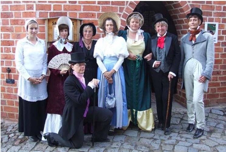
Die acht Frauen der Werbener Theatertruppe Altmärkisches Treibgut vor ihrer Spielstätte der Salzkirche in Werben

Seit 2005 gibt es in unserer Biedermeierstadt eine Theatertruppe, die das kulturelle Leben der Stadt entscheidend bereichert hat. 10 spielfreudige Frauen bieten anspruchsvolles Theater realisiert mit einfachsten Mitteln. Ohne Anleitung durch gelernte Theatermacher wagen sich diese Laiendarsteller an die Realisierung großer Theaterstücke, die alle in der Zeit des Biedermeiers entstanden sind. Es begann 2008 zum Biedermeier-Sommer mit "Der zerbrochene Krug" nach Heinrich von Kleist. 2009 folgten "Die deutschen Kleinstädter" von August von Kotzebue, und in diesem Jahr "Der Talisman" von Johann Nestroy.